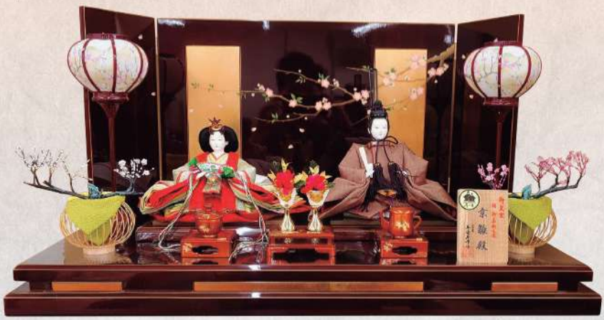
平安寿峰作 正絹有職 麴塵染玉虫色襲 京十番親王揃