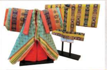
●衣装を一枚一枚実際の着物と同じように仕立ててから着付けます。

一般的な雛人形の衣装は、写真のように腰の部分で上半身と下半身を別々に着せ、袖の重ねを見える部分だけ仕立ててあります。通常の着せ方とは違い 実際の着物と同じように着せた人形を、本着せと呼びます。 その中でも特に細かい部分までこだわりを持って造られた人形を 本仕立て と呼び、雛人形の中で一番手間をかけた最高級の仕立てになります。