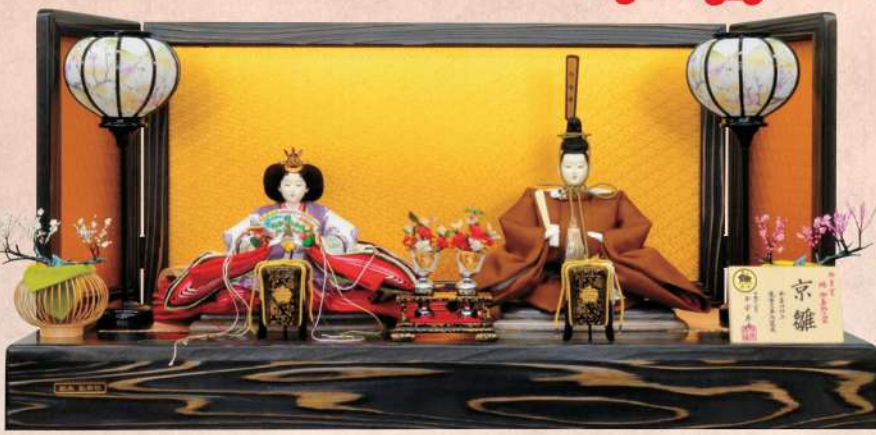
平安寿峰作 有職裂「桐竹鳳凰文 黄植染御袍」 京八番親王揃